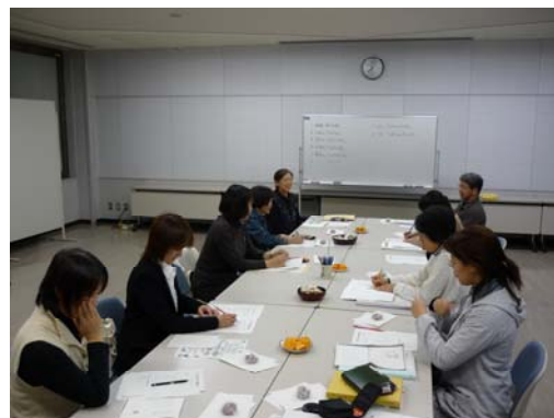
(写真/お話しボランティア研修)