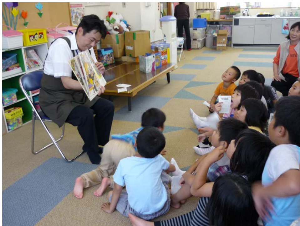
(写真/放課後児童クラブでのお話し会)