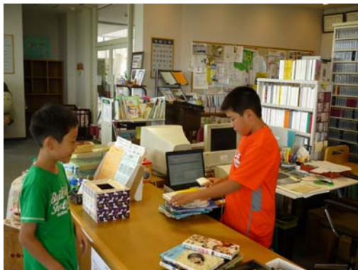
(写真/小学生一日図書館員)

図書館が中心となり、子どもの読書推進に向けて上記のボランティアなどを対象とした研修の機会や場所や情報を提供し、支援していきます。