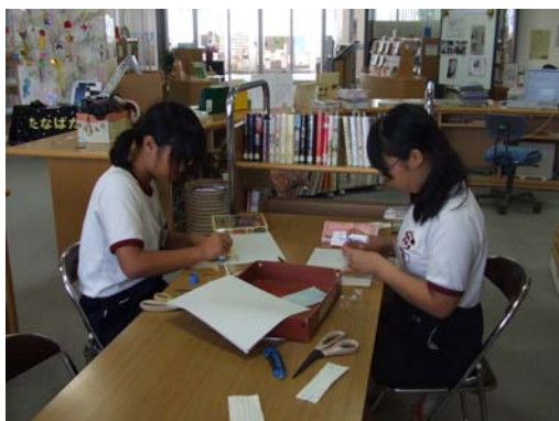
(写真/中学生職場体験)