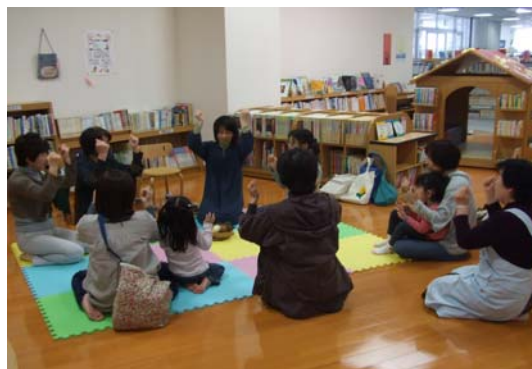
(写真/土ようおはなし会)

子どもが成長するにあたり、その発達段階に応じて、日常的に本と親しむことができる機会をつくることで、より良い読書習慣が身に付くと考えられます。本との出会いで、豊かな人間性を育むことができるよう、子どもの読書活動を推進します。